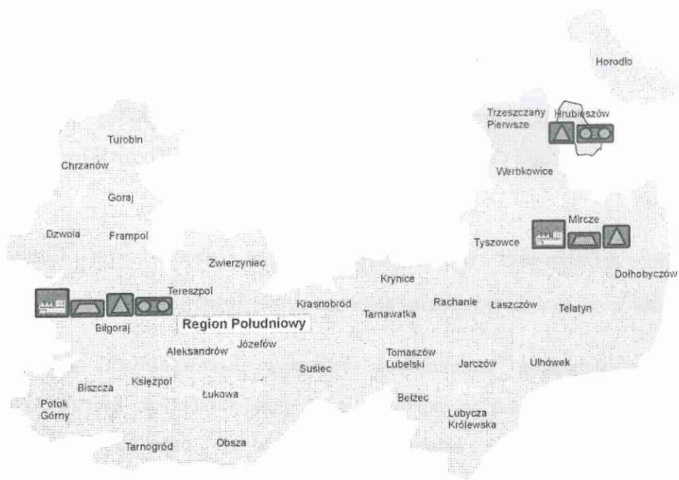
Rysunek 1 Region południowy gospodarki odpadami komunalnymi województwa lubelskiego.